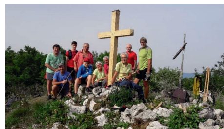
Montage le 19 juin 2021

Il ne vous reste qu'à rebrousser chemin jusqu'à la bifurcation et entamer la descente.