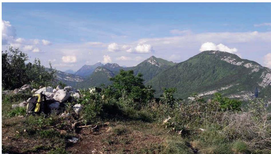
Le sommet des Bauges