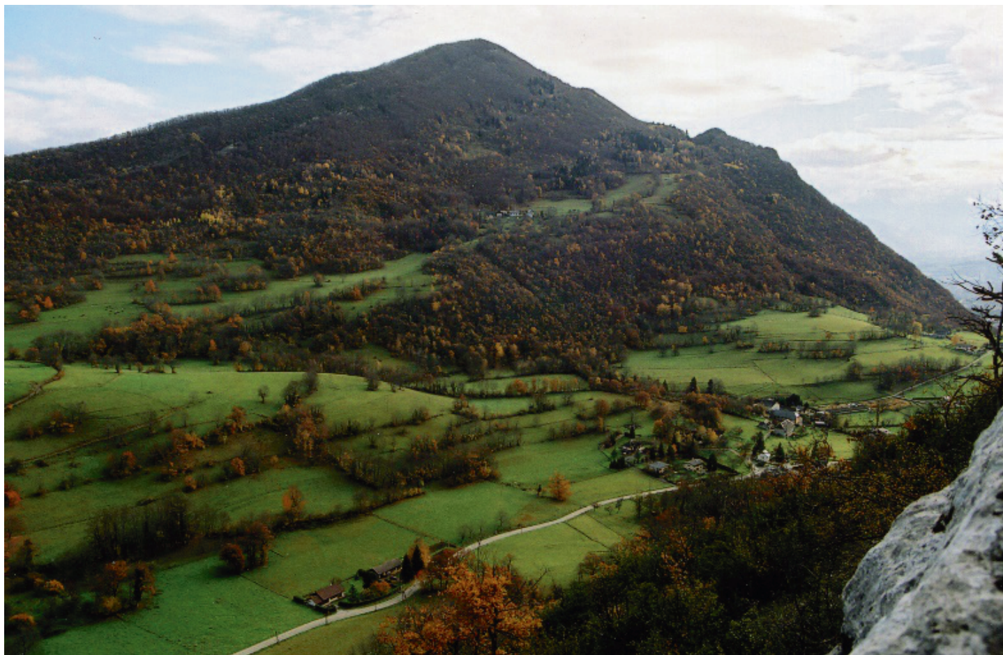
La montagne de Montgelas vue de la Roche Blanche

Moins prisée que la chapelle du Mont Saint-Michel, la croix de Montgelas est pourtant le point culminant de la commune et propose elle-aussi un beau panorama.